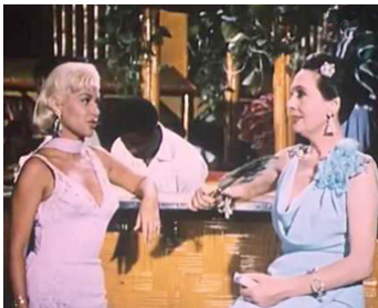
1957 LE PASSAGER CLANDESTIN de Ralph Habib avec Arletty