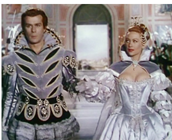
1953 LUCRÈCE BORGIA de Christian-Jaque avec Massimo Serato