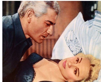
1958 TOUT PRÈS DE SATAN (Ten Seconds to Hell) de Robert Aldrich avec Jeff Chandler