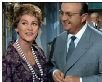
1962 LE CAVE SE REBIFFE de Gilles Grangier avec Bernard Blier