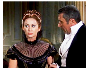
1961 VANINA VANINI de Roberto Rossellini avec Paolo Stoppa