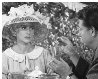
1960 UN SOIR SUR LA PLAGE de Michel Boisrond avec Jean Desailly