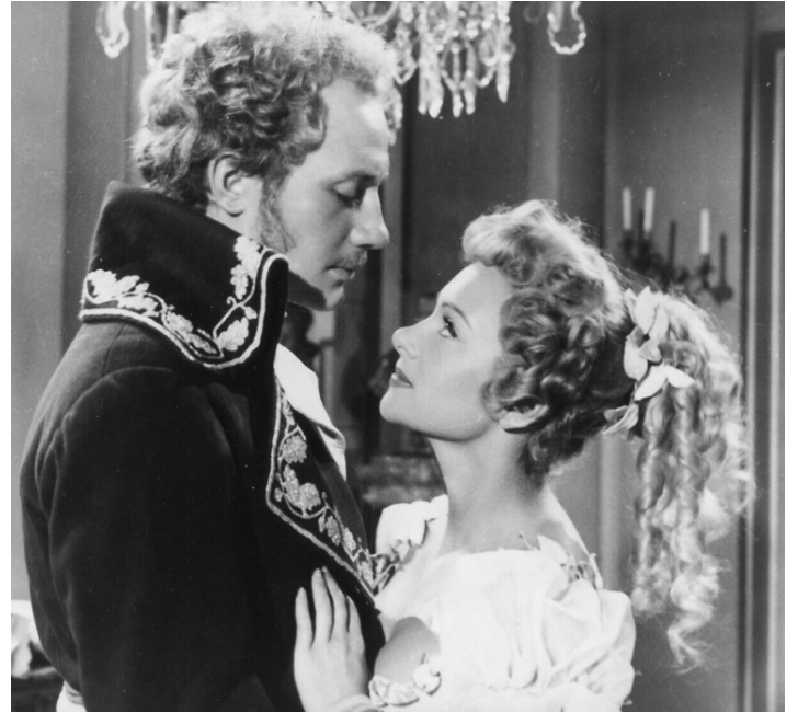
1950 CAROLINE CHÉRIE de Richard Pottier avec Jacques Dacqmine