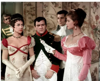
1959 AUSTRERLITZ d'Abel Gance avec Pierre Mondy, Claudia Cardinale