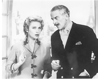
1955 LES CARNETS DU MAJOR THOMPSON de Preston Sturges avec Jack Buchanan