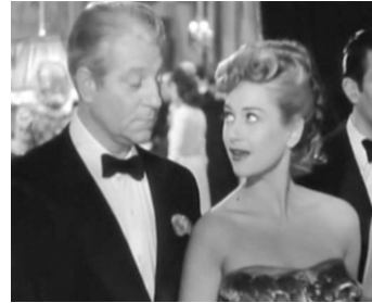
1946 MIROIR de Raymond Lamy avec Jean Gabin