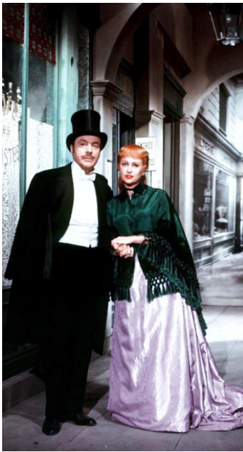
1954 NANA de Christian-Jaque avec Charles Boyer