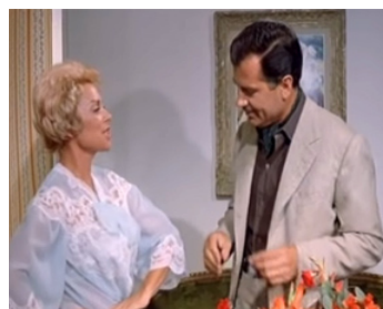
1962 LES DON JUAN DE LA CÔTE D'AZUR de Vittorio Sala avec Gabriele Ferzetti