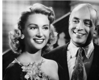
1949 NOUS IRONS À PARIS de Jean Boyer avec Ray Ventura