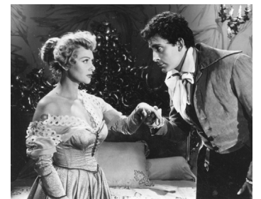
1952 UN CAPRICE DE CAROLINE CHÉRIE de Jean Devaivre avec Jean-Claude Pascal