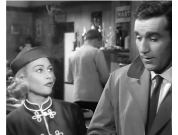
1957 NATHALIE de Christian-Jaque avec Michel Piccoli