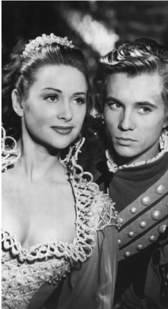
1948 LES AMANTS DE VÉRONE d'André Cayatte avec Philippe Lemaire