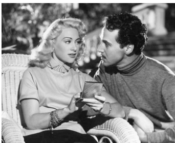
1951 LE DÉSIR ET L'AMOUR d'Henri Decoin avec Antonio Vilar