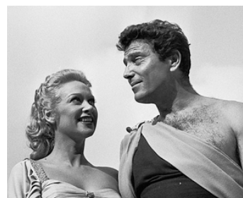
1953 DESTINÉES, partie Lysistrata de Christian-Jaque avec Raf Vallone