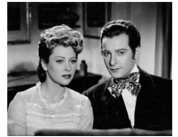
1945 TRENTE ET QUARANTE de Gilles Grangier avec Georges Guétary