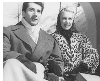
1952 ADORABLES CRÉATURES de Christian-Jaque avec Daniel Gélin