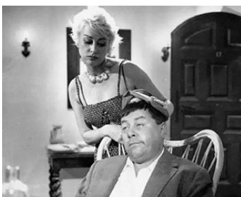
1961 EN PLEIN CIRAGE de Georges Lautner avec Francis Blanche