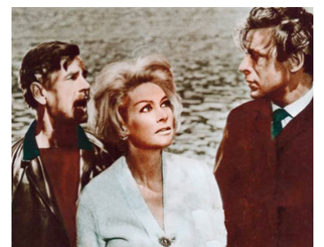
1966 L'ENFER EST VIDE (Hell is empty) de Bernard Knowles avec J. Conrad, A. Steel