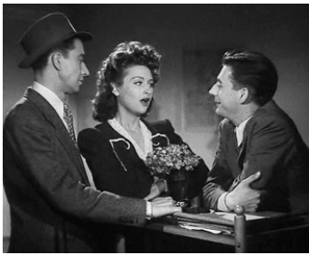
1943 LA FERME AUX LOUPS de Richard Pottier avec Paul Meurisse, François Périer