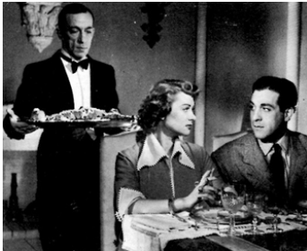
1949 JE N'AIME QUE TOI de Pierre Montazel avec Raymond Bussières, Luis Mariano