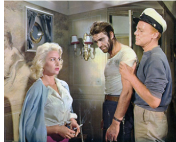
1956 AU BORD DU VOLCAN (Action of the Tiger) de T. Young avec Sean Connery, Van Johnson