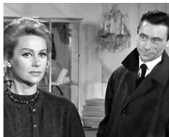
1960 LA FRANÇAISE ET L'AMOUR de Jean-Paul Le Chanois avec Robert Lamoureux