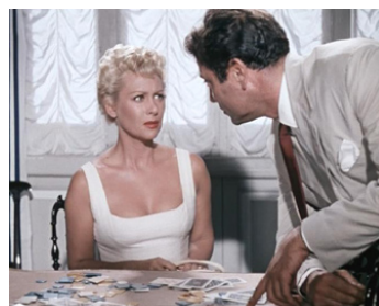
1953 LA PENSIONNAIRE (La Spiaggia) d'Alberto Lattuada avec Raf Vallone