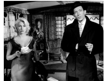
1959 NATHALIE AGENT SECRET d'Henri Decoin avec Philippe Clay