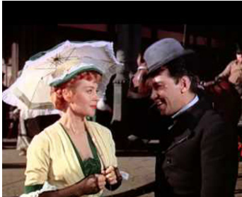
1956 LE TOUR DU MONDE EN 80 JOURS (Around the World in 80 days) de M. Anderson avec Cantinflas