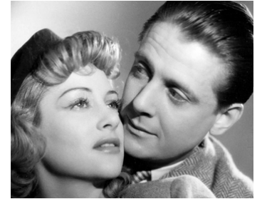
1947 CARRÉ DE VALETS d'André Berthomieu avec Jean Desailly