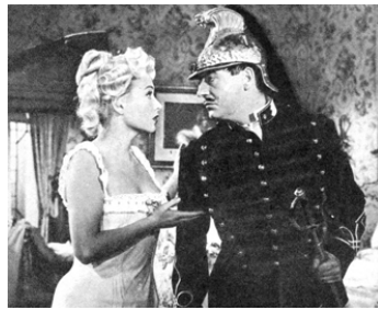
1954 SECRETS D'ALCOVE, Le Lit de la Pompadour de Jean Delannoy avec François Périer