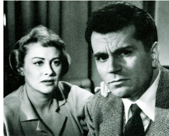
1956 SCANDALE À MILAN (Difendo il mio amore) de G. Macchi avec Gabriele Ferzetti