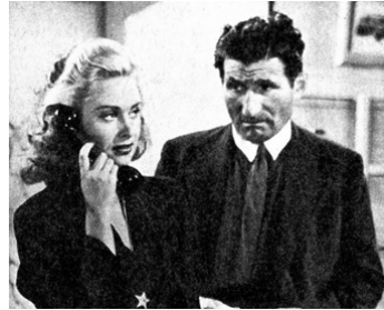
1946 VOYAGE SURPRISE de Pierre Prévert avec Marcel Pérès