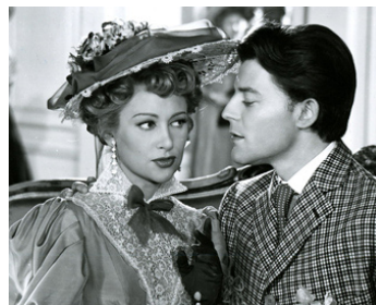
1951 LES BELLES DE NUIT de René Clair avec Gérard Philipe