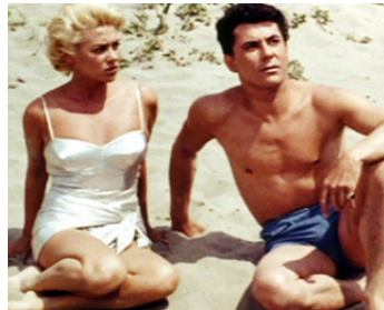
1958 LES NOCES VÉNITIENNES (La Prima Notte) d'Alberto Cavalcanti avec Ph. Nicaud